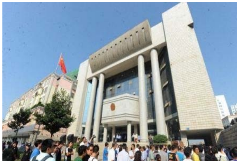
再审开庭后的昭通中院外场景

2009年5月16日，李昌奎强奸杀害少女王家飞，并将王家飞3岁的弟弟摔死。之后，李昌奎潜逃。2009年5月20日，李昌奎出逃4天后，逃至四川省普格县时向城关派出所投案自首，被采取刑事拘留措施，同年6月3日被批准逮捕。