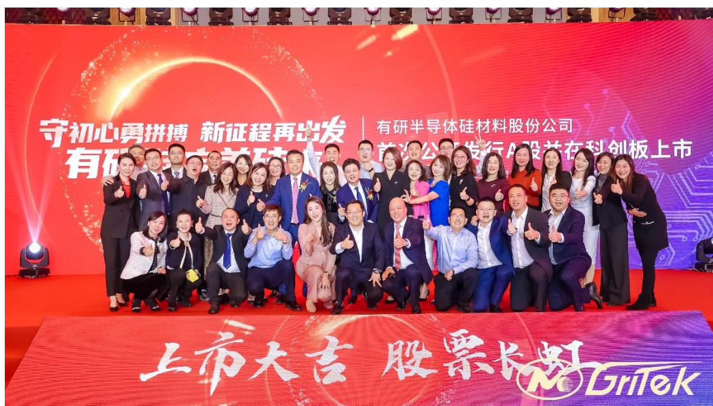
图片/上市答谢会合照